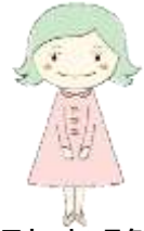
中北マナーキャラクター 中北みどりちゃん