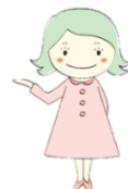
中北マナーキャラクター 中北みどりちゃん

●感染予防対策を行ったうえで、出張セミナーも開催しております。お気軽にお問い合わせください。